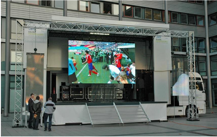
Ein 40 t Promotionauflieger als Showbühne (2009)