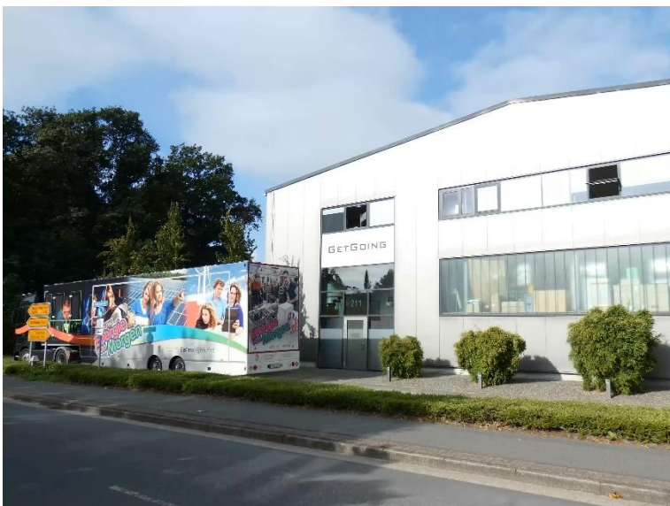
Die Eilers-Halle heute