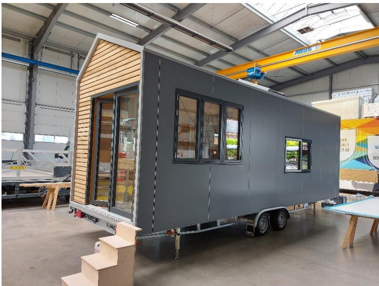
Das erste Tiny-House von Eilers (2022)