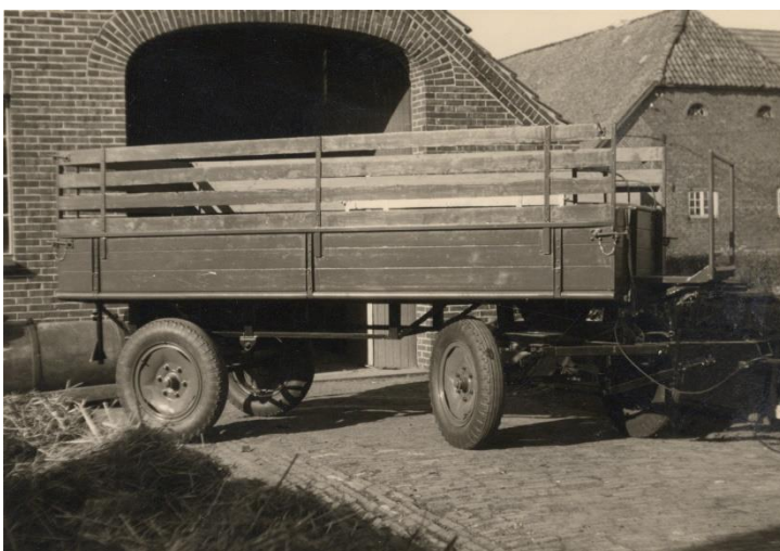
Gummiwagen (1950er Jahre)