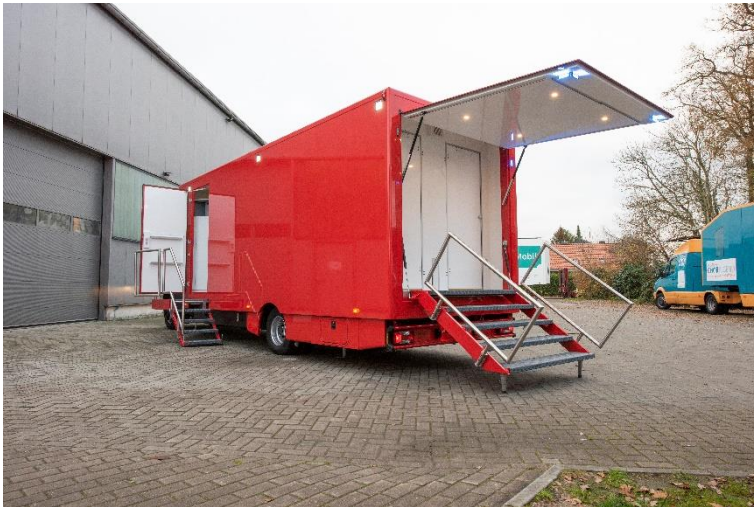
Das neu entwickelte Hygiene-Mobil (2022)